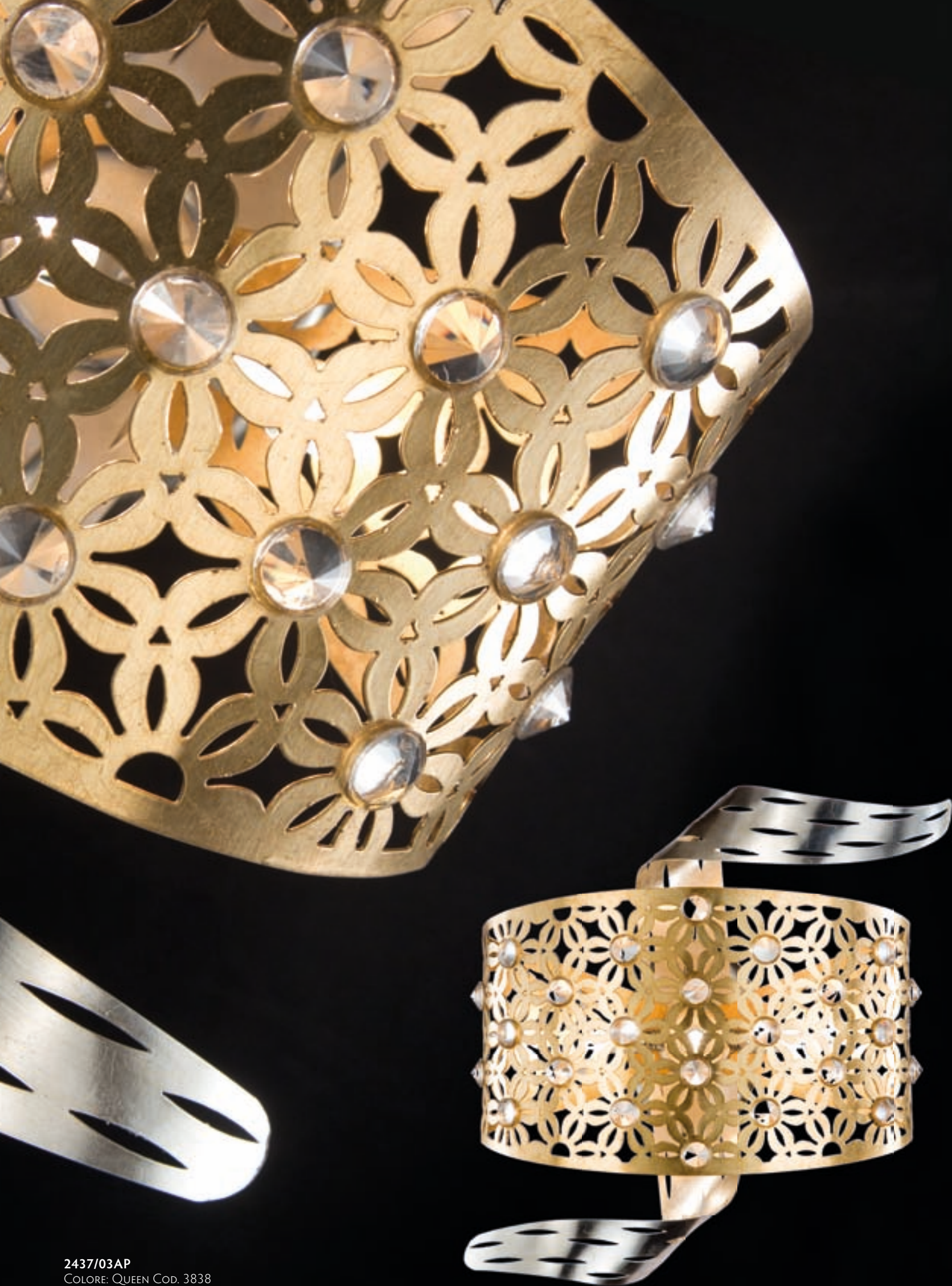
2437/03AP COLORE: QUEEN COD. 3838 CM. H. 44 X L. 35 X P. 19 3 X G9 MAX 40 WATT