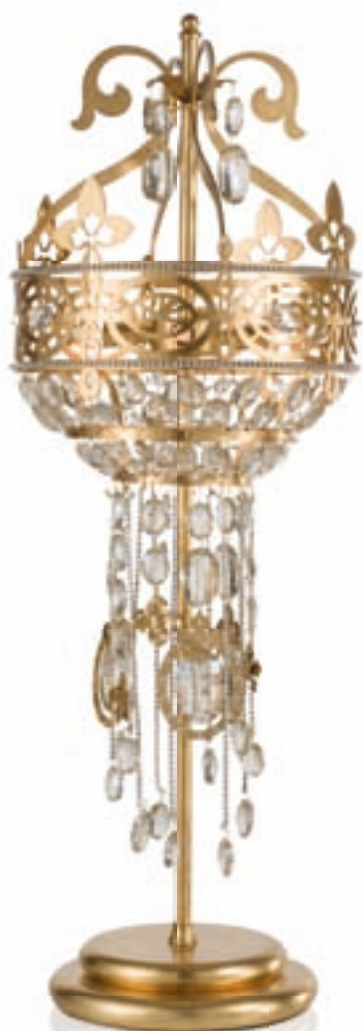
2438/04BA COLORE: ORO FOGLIA COD. 3001 CM. H. 84 x Ø 30 4 x G9 MAX 40 WATT