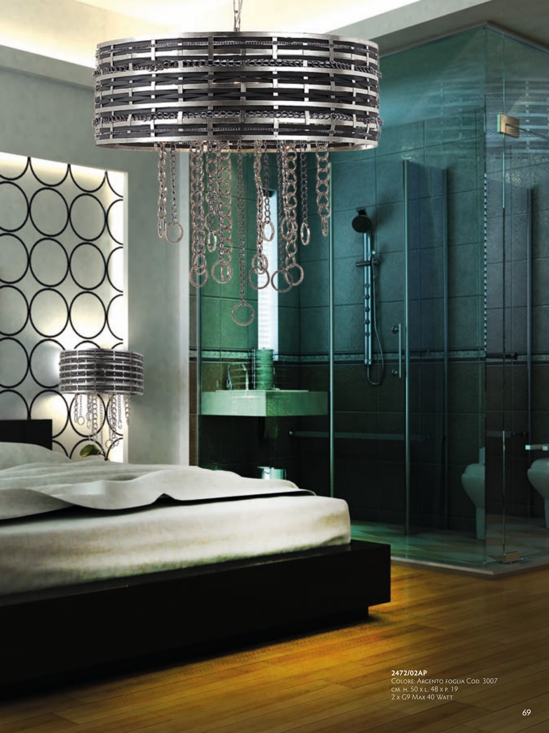
2472/02AP COLORE: ARGENTO FOGLIA COD. 3007 CM. H. 50 x L. 48 x P. 19 2 x G9 MAX 40 WATT